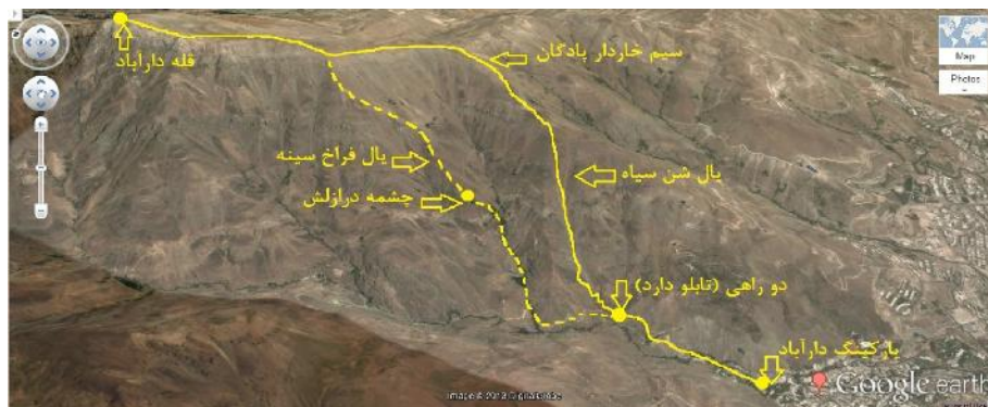
شکل - مسیر های صعود به قله دارآباد