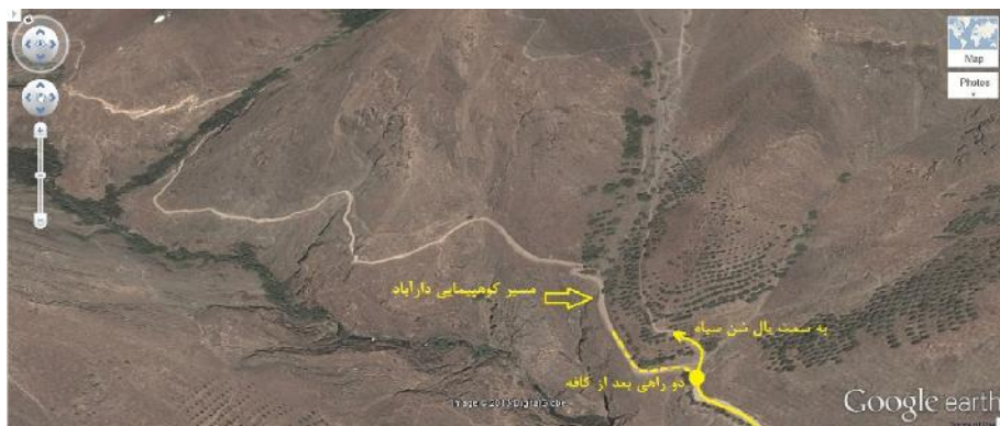
شکل - دو راهی پال شن سیاه