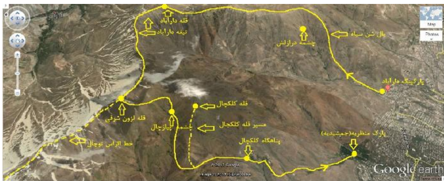
شکل - نمایی از مسیر برنامه